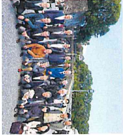
(左) 調停委員の皆さん

昨年の11月に久しぶりに、武蔵野民謡調停協会の日帰り旅行に行ってきました。武蔵野民謡調停協会というのは、三郷にある武蔵野民謡研究所に所属している調停委員が組織している団体で、裁判所との情報交換や調停委員同士の親睦や研修、近隣住民に対する調停制度の広報などを行っています。自分所属しているから思うのもかもしれませんが、武蔵野民謡調停協会は、特に熱心に活動を行っています。会の行事への参加率も高く、調停委員を返したOBも参加して、コロナ前は、1年おきに、泊りと日帰りの旅行を行っています。 今年は、コロナ禍以来4年ぶりの旅行というところあって、幹事の方も、特に熱心に企画を立てて下さり、日帰りではありましたが、とても充実した内容の旅行でした。 新都市前に集合して、バスで皇居外苑の二重橋を過ぎ、散策して、集合写真を撮りました。二重橋から東武方面を見ると、ビルが高さを誇られて、きれいに並んで建ち、とても綺麗です。きれいに並んで建ち、とても綺麗です。きれいに並んで建ち、とても綺麗です。きれいに並んで建ち、とても綺麗です。